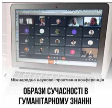
Міжнародна науково-практична конференція ОБРАЗИ СУЧАСНОСТІ В ГУМАНІТАРНОМУ ЗНАННІ

Державний торговельно-економічний університет у режимі прямої онлайн-трансляції із дотриманням заходів безпеки провів III міжнародну науково-практичну конференцію «Образи сучасності в гуманітарному знанні». Обговорювалися актуальні питання міждисциплінарної та поліпарадигмальної рефлексії сьогодення на постнекласичному етапі розвитку сучасної цивілізації, а також громадянського покликання журналістики у контексті кібернетичних, інформаційних та гібридних воєн, формування інформаційної безпеки у глобальному та національному масштабі, маніпулятивних можливостей масмедіа.