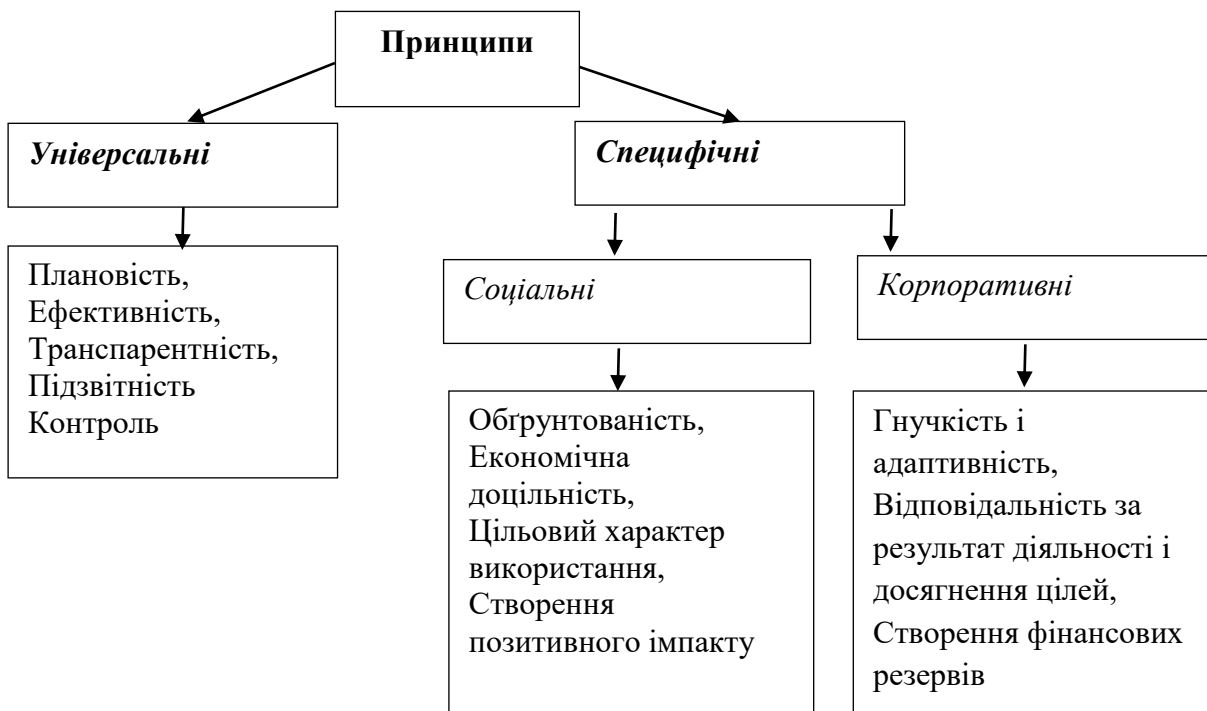
Рис.2. Принципи фінансування підприємств комунальної власності

Капітал підприємства комунальної власності формується під впливом двох процесів: фінансово-господарська діяльність самого підприємства та бюджетний процес на місцевому рівні. Принципи формування капіталу базуються на принципах бюджетного фінансування, принципах фінансування підприємств та принципах надання міжнародної фінансової допомоги (рис.2).