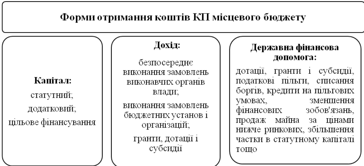
Рис.1. Форми отримання коштів підприємствами комунальної власності з місцевого бюджету

Капітал підприємства комунальної власності формується під впливом двох процесів: фінансово-господарська діяльність самого підприємства та бюджетний процес на місцевому рівні. Принципи формування капіталу базуються на принципах бюджетного фінансування, принципах фінансування підприємств та принципах надання міжнародної фінансової допомоги (рис.2).